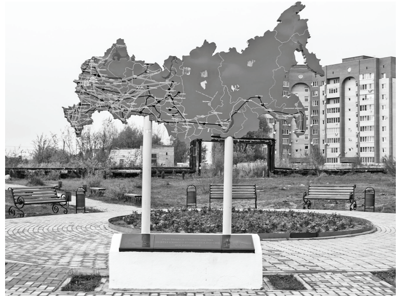
Министерство внутренней политики и массовых коммуникаций Калужской области.

Калужской области в 2017 году на реализацию проекта выделено из федерального бюджета 262 млн. рублей. Всего же, с учетом субсидий из областного бюджета, на развитие городской среды направлено более 545 млн. рублей.