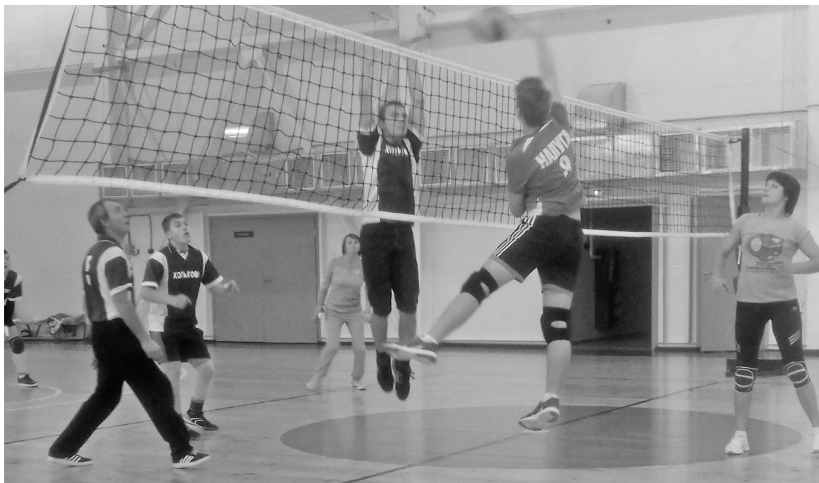
На площадке - сборная с Хотьково и команда «Поколение».

Напоминаем, для посещения ФОКа необходима сменная обувь.